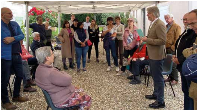
Quartier Le Tremblay - Les Feugères le 3 juin