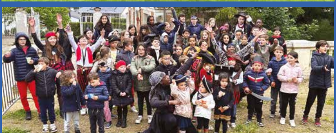
1 er juin - Malgré le mauvais temps, les visiteurs sont venus nombreux profiter de multiples activités présentes au Plateau Saint-Marc pour la fête de la jeunesse et du sport. La police municipale d'Orgeval proposait d'initier et de sensibiliser les enfants au code de la route. Le matin, une cinquantaine d'enfants avait participé à une chasse au trésor au Parc de la Brunetterie organisée par le Conseil Municipal des Jeunes.