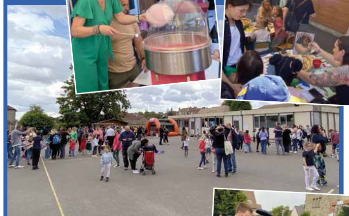
Juin - Kermesses et traditionnels spectacles de fin d'année se sont déroulés dans les écoles et à l'Espace Claude Rich, pour le grand bonheur de nos petits élèves. Et bravo aux enseignants !