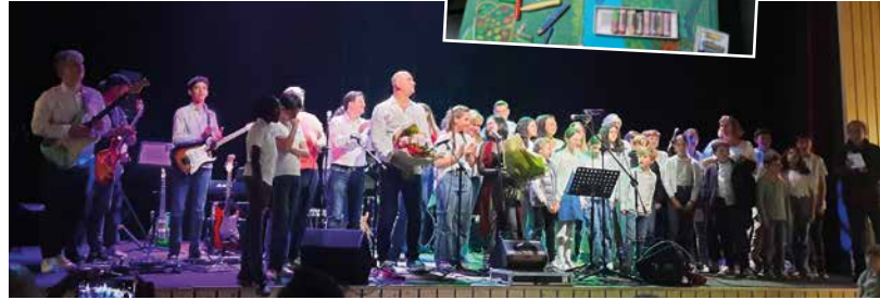
2 juin - Devant un parterre comble, l'association Arts et Loisirs a célébré ses 50 ans. Les différentes disciplines (Tai Chi Chuan, musique, chant, arts plastiques) étaient regroupées pour cette journée de célébration.