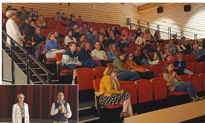
14 mai - Projection du documentaire « Et si on levait les yeux », qui traite de la place des écrans dans le quotidien des enfants, suivie d'un débat avec le réalisateur Gilles Vernet.