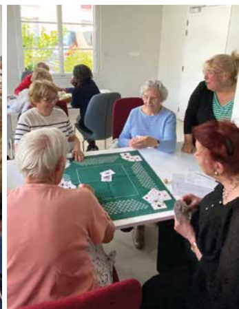
10 juin - Le Centre Communal d'Action Sociale a réuni une trentaine de seniors à l'Espace de Vie Sociale pour un goûter avec jeux de sociétés et échanges conviviaux.