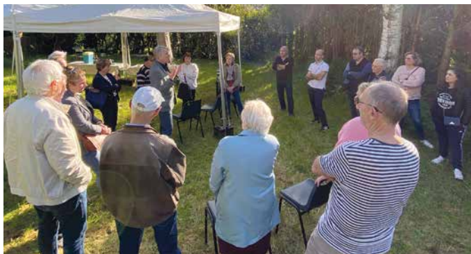
Quartier Picquenard le 15 mai, chez un particulier

Du 15 mai au 17 juin, la Ville d'Orgeval a organisé plusieurs rencontres avec les référents et les habitants de chaque comité de quartier pour échanger sur les sujets qui impactent tous les riverains. Circulation, voirie, transports, stationnement, travaux et urbanisme, attractivité commerciale, sécurité, espaces verts... autant de préoccupations, de questionnements ou de propositions qui ont produit des débats intéressants, des réponses concrètes et des réflexions pour de futurs projets.