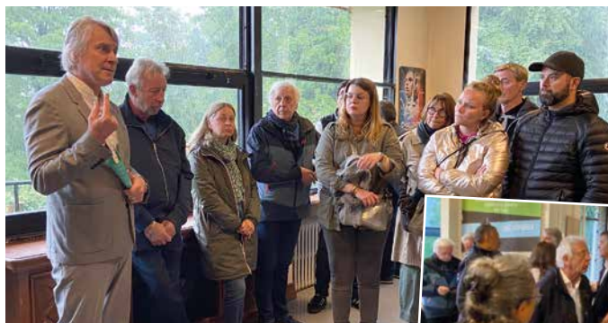
Quartier La Chapelle le 29 mai

vie de la cité. Forts de cette nouvelle expérience, les élus poursuivront bien évidemment la consultation des référents et des membres des différents comités de quartier pour façonner, ensemble, le visage de la ville de demain.