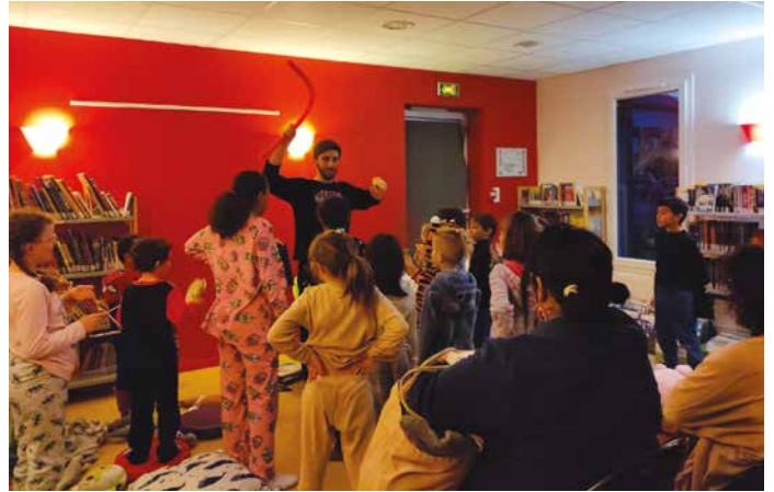
22 mars - Dans une ambiance feutrée et chaleureuse, les nombreux enfants et adultes (venus en pyjamas, avec leurs doudous et oreillers) ont vibré au son des instruments de musique qui accompagnaient les histoires lors de la soirée «Pyja'contes» organisée par la bibliothèque Jeanne Denis, en partenariat avec la médiathèque Quincy Jones de Mantes-la-Jolie.