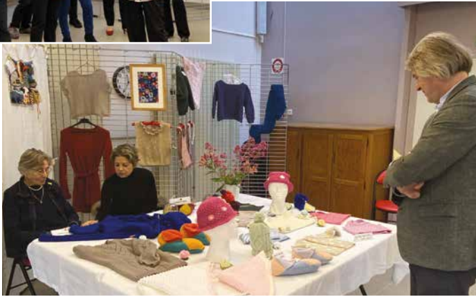
1 er et 2 juin - L'association Le Passe-Partout a organisé son exposition annuelle de loisirs créatifs ayant pour thème « Les fleurs » : mosaïque, couture, réfection de sièges, cartonnage, pastel...