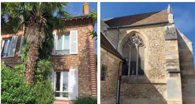
Villa Art-Déco années 1903-1905, Rue du docteur Maurer L'Orme Gauthier Église Saint-Pierre Saint-Paul, centre-ville

Quelques édifices sont des repères historiques qui attestent la présence de la meulière au Moyen-Âge sur le territoire : les fondations de la grande abbaye d'Abbecourt, de l'église Saint-Pierre Saint-Paul ou encore de la Chapelle Saint-Jean. Mais notre commune a une autre particularité puisqu'on y trouve toute la filière des meulières, de son extraction à l'ensemble