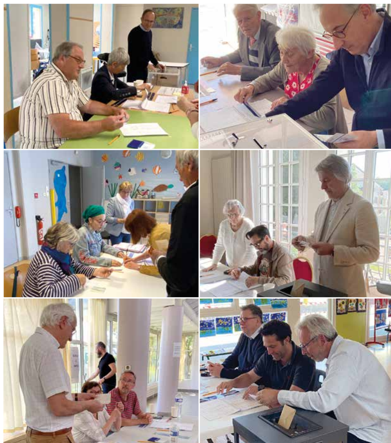
Bureaux de vote lors des dernières élections européennes