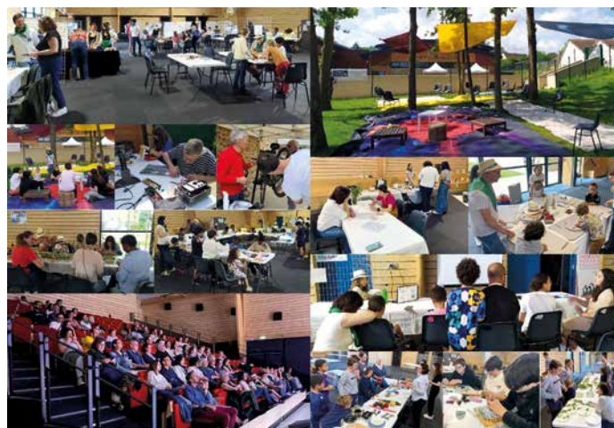
25 et 26 mai - La Tribu des explor'acteurs a embarqué petits et grands dans un week-end chargé en activités et découvertes autour de l'écologie.