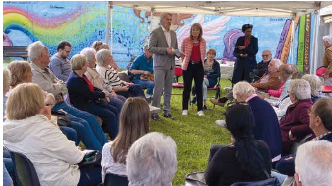
Quartier Montamets le 17 juin