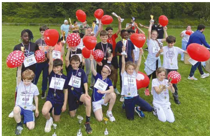
7 mai - Le cross solidaire pour soutenir l'association Mécénat Chirurgie Cardiaque a réuni les écoles Pasteur et Jean de la Fontaine pour une belle cause, celle des enfants atteints de malformations cardiaques.