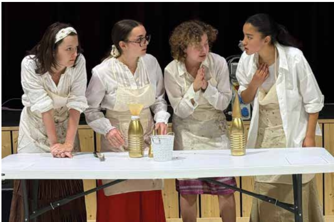
8 juin - La section adolescents de l'association de théâtre Le Geste présentait cette année un spectacle immersif « Elles ont dû faire toutes les guerres », évoquant le rôle des femmes pendant la Première Guerre mondiale.