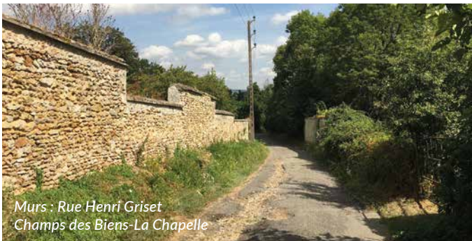
Murs : Rue Henri Griset Champs des Biens-La Chapelle

En 2024, l'association Histoire d'Orgeval a créé un atelier de recherche consacré à la roche meulière. Identité remarquable de notre commune, elle est encore visible sur de nombreuses propriétés, qu'il s'agisse des grandes villas, des édifices remarquables comme des maisons rurales plus modestes.