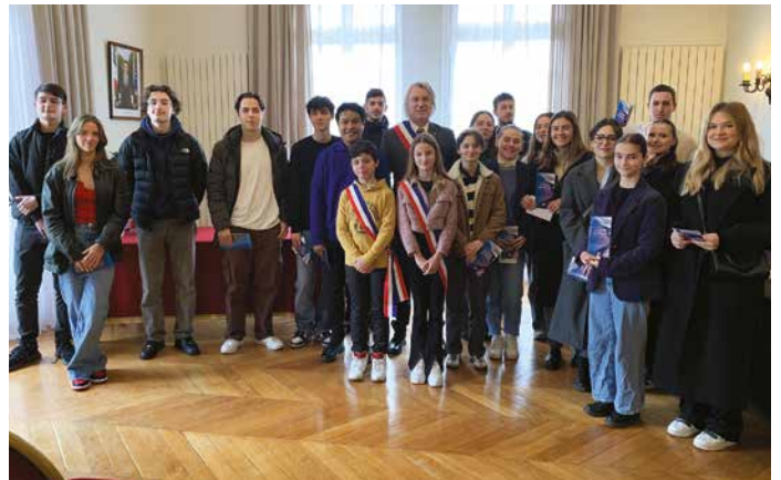
30 mars - Une soixantaine de jeunes majeurs orgevalais ont répondu présents pour la cérémonie de citoyenneté organisée par la Ville, en collaboration avec le Conseil Municipal des Jeunes, où chaque invité s'est vu remettre sa première carte d'électeur et le livret du citoyen.