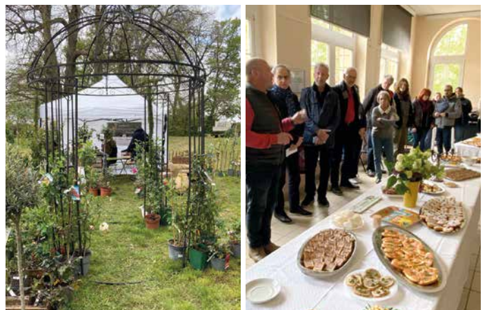
20 et 21 avril - Le Lions Club a organisé la 9 e édition des Florales, avec plus de 1500 visiteurs. Les bénéfices de cet événement permettront de financer l'achat d'un écran intégré à l'IRM pour l'hôpital de Poissy Saint-Germain-en-Laye.