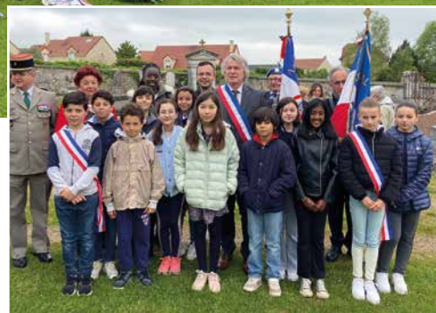
8 mai - Élus et citoyens se sont rassemblés pour commémorer le 79 e anniversaire de la victoire de 1945 et rendre ainsi hommage aux soldats tombés au champ d'honneur.