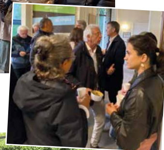
Quartier Haut Orgeval - Les Bouillons le 31 mai