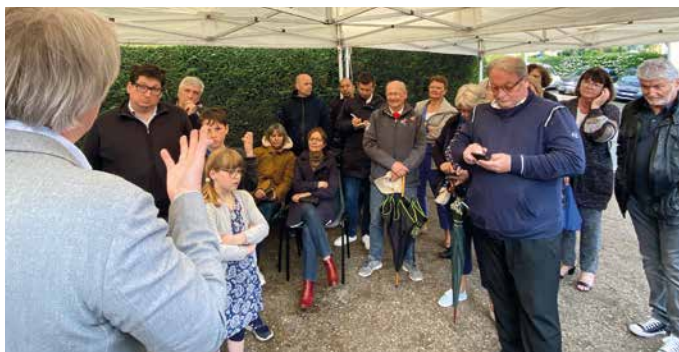
Quartier Maison Blanche le 22 mai

Au total, sur l'ensemble des 7 réunions, ce sont plusieurs dizaines d'Orgevalais qui ont montré un intérêt certain pour la