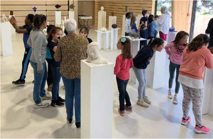
22 au 24 mars - L'espace Claude Rich a accueilli l'exposition de l'Atelier de sculpture d'Orgeval avec pour invité d'honneur le sculpteur français Benjamin Georgeaud. Les visiteurs, tout comme les élèves des écoles de la Ville ont ainsi pu découvrir les très belles œuvres réalisées par les adhérents.