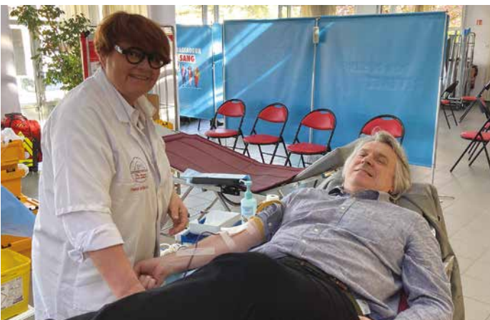
12 avril - Merci aux 68 volontaires et 13 nouveaux donneurs venus pour cette nouvelle collecte de sang, ainsi qu'à toute l'équipe de l'EFS pour sa bonne humeur et sa présence rassurante auprès des participants.