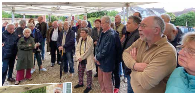
Quartier Centre-ville le 23 mai