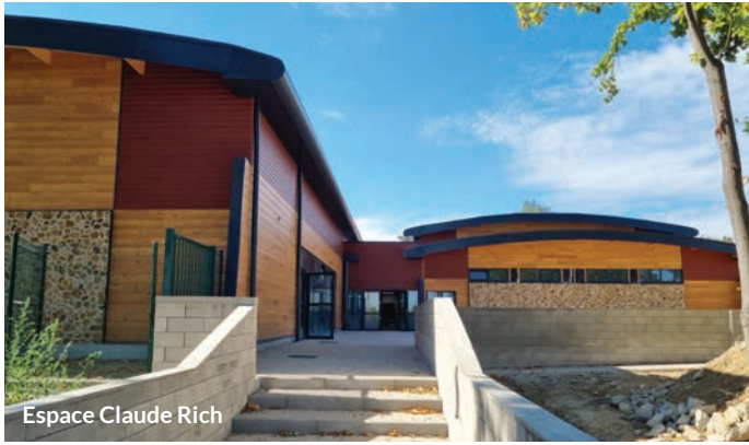
Espace Claude Rich

Pour la première fois à Orgeval, nous disposerons d'infrastructures qui permettront par exemple de jouer au handball ou au basket en intérieur. Nous aurons une vraie salle de spectacle pour accueillir du théâtre, des concerts mais aussi pour développer les activités de notre Ciné club.