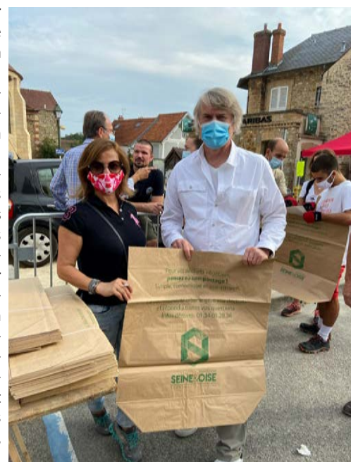
JOURNÉE INTERNATIONALE DU NETTOYAGE DE LA PLANÈTE - SAMEDI 14 SEPTEMBRE 2020.

Enfin, et toujours afin d'informer les citoyens, nous allons proposer aux Orgevalais une visite du centre de tri de Triel, qui traite les déchets d'Orgeval. A nous de suivre maintenant la mise en place de ces aménagements.