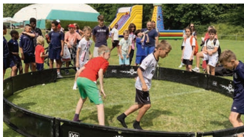
10 et 11 juin Fête de la jeunesse et du sport au plateau Saint-Marc : de nombreux ateliers, démonstrations sportives et stands d'animations proposés par les services jeunesse et sport, avec la participation des associations sportives orgevalaises et de la police municipale. Plus de 150 spectateurs ont également pu apprécier le spectacle du Portugal Comedy Club à l'Espace Claude Rich.