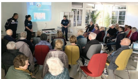
3 avril Réunion de prévention sécurité destinée aux seniors, à l'initiative du Club de l'amitié et en partenariat avec la Police municipale