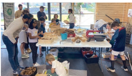
13 et 14 mai «Retour vert les futurs», week-end autour de l'écologie organisé par l'association La Tribu des explor'acteurs