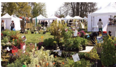
15 et 16 avril 8 e édition des Florales organisée par le Lions Club au Parc de la Brunetterie, au profit de l'hôpital de Poissy