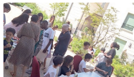
3 juin Fête des voisins avec goûter partagé initié par l'équipe de l'Inter'val (Espace de vie sociale)