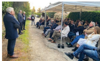
Comité de quartier des Montamets lundi 15 mai, Sente de la Grande Brèche

Entre le 15 mai et le 19 juin, le Maire Hervé Charnallet, les élus et les référents de chaque quartier ont pu échanger autour du cadre de vie ainsi que des projets en cours et à venir. L'occasion pour la Municipalité d'écouter et d'apporter des réponses concrètes aux questions des habitants.