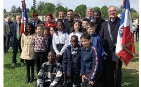
8 mai Commémoration du 78 e anniversaire de la victoire du 8 mai 1945, en présence d'élus locaux : défilé, levée des couleurs, dépôts de gerbes, Marseillaise entonnée par de jeunes Orgevalais, discours et recueillement en mémoire des héros et victimes de la Seconde Guerre mondiale.