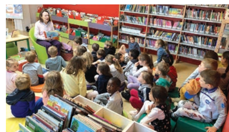
24 mai Animation «Contes et Merveilles» proposée par la bibliothèque avec lectures de contes et atelier cahier d'imagination