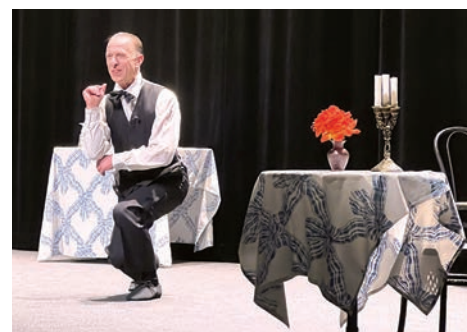
17 avril Pièce de théâtre «M'sieur Offenbach» proposée par le service social aux seniors