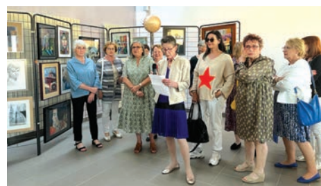
2 et 3 juin Vernissage de l'exposition «Art déco» de l'association Le Passe-Partout à la Croisée