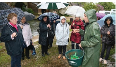
9 mai Sortie organisée par le Club de l'amitié à la pisciculture de Villette, suivie d'un déjeuner au restaurant