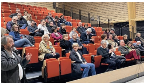
1 er avril Conférence d'astronomie initiée par l'association Arès & Antarès