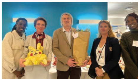
10 mai Vernissage de l'exposition «Atelier terre» présentée par l'association de sculpture d'Orgeval à l'EVS