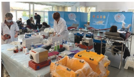
31 mars Don du sang à la Croisée, avec 68 volontaires dont 5 nouveaux donneurs