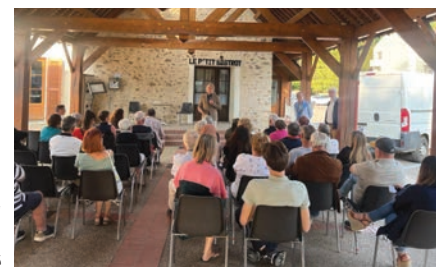
Comité de quartier du centre-ville lundi 5 juin, sous la halle du marché

► www.ville-orgeval.fr/vie-municipale/comites-de-quartier