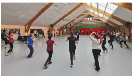
15 avril Stage de self-défense féminin dispensé par l'Amicale Orgevalaise de Krav Maga