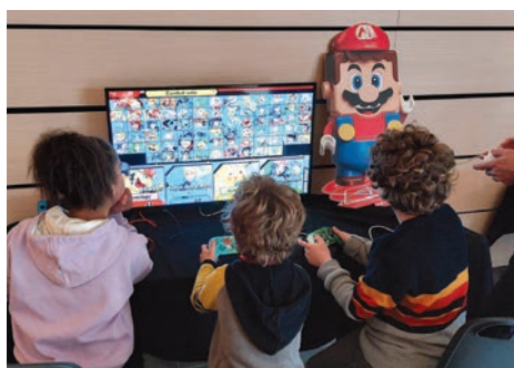
16 avril 1 re édition de l'Orgeval Vidéo Games à l'Espace Claude Rich