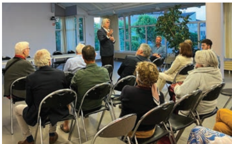
Comité de quartier de la Maison Blanche jeudi 25 mai, la Croisée

Acteurs incontournables de la citoyenneté locale, les comités de quartier d'Orgeval sont au nombre de sept : Le Tremblay/ Les Feugères, Picquenard, La Chapelle, Maison Blanche, Centre-Ville, Montamets et Haut Orgeval/Les Bouillons. Chaque quartier affiche ses préoccupations mais tous ont la même volonté de faire bouger notre ville pour la préservation de notre cadre de vie et l'amélioration du service public.