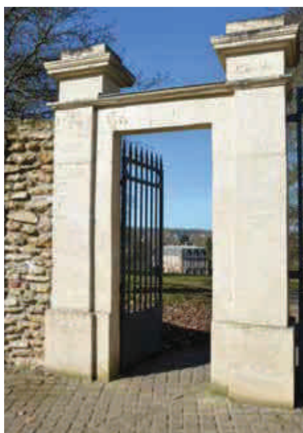
Les étudiantes ont étudié les essences des arbres du parc

en fonction des nouveaux usages, du fleurissement, du mobilier urbain à placer... Pour cela, la Municipalité souhaite qu'un paysagiste professionnel travaille sur le réaménagement du parc en s'inspirant et s'inspirant d'Édouard André. Un architecte du patrimoine sera, quant à lui, chargé de réaliser un diagnostic en vue de restaurer les façades extérieures et les toitures des communs. Le but étant de leur redonner leur apparence originale du XIX e siècle.